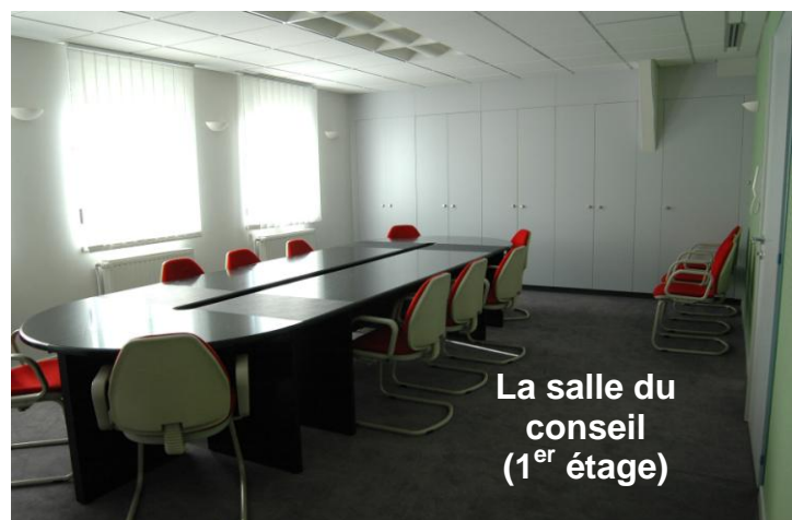
La salle du conseil (1 er étage)

ATTENTION ! Nouveaux horaires à partir du 1 er août 2004 :