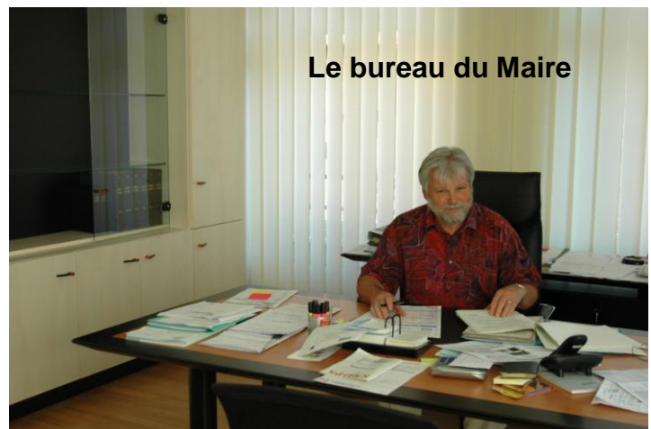
Le bureau du Maire