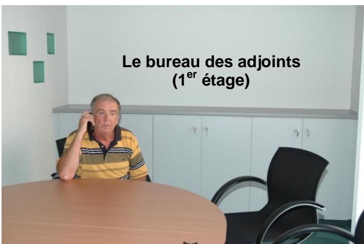
Le bureau des adjoints (1 er étage)